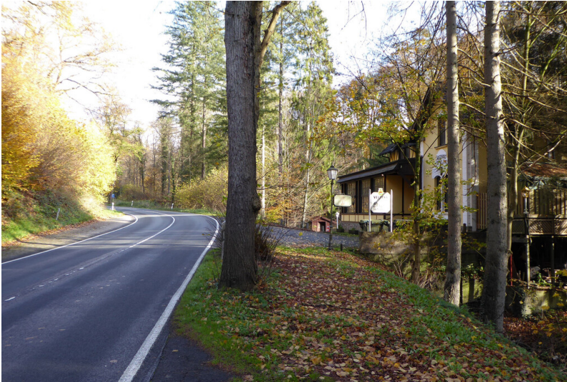
Schmelztalstraße auf Höhe der Gaststätte Jagdhaus im Schmelztal in Bad Honnef (2022).