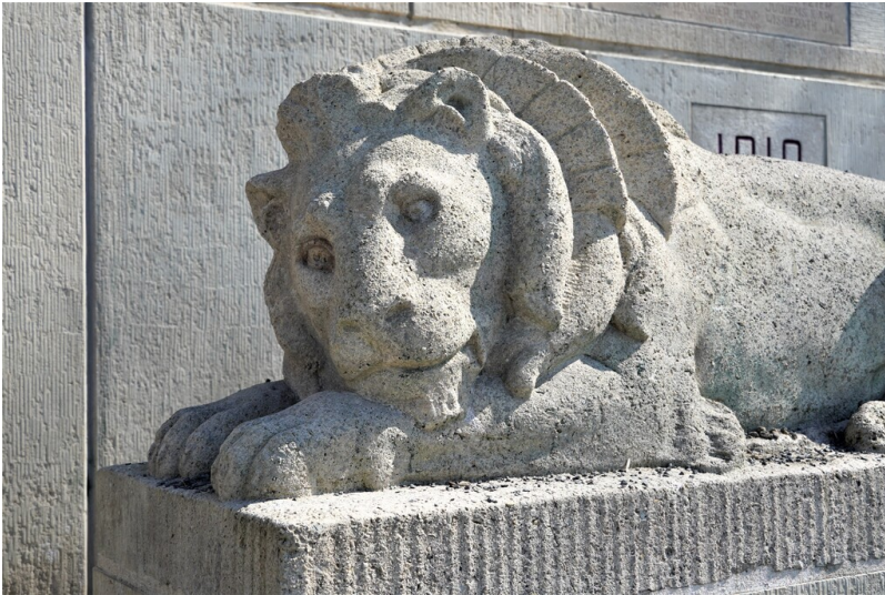
Die Löwenskulptur des Kriegerdenkmals am Rheinufer in Köln-Porz (2023).