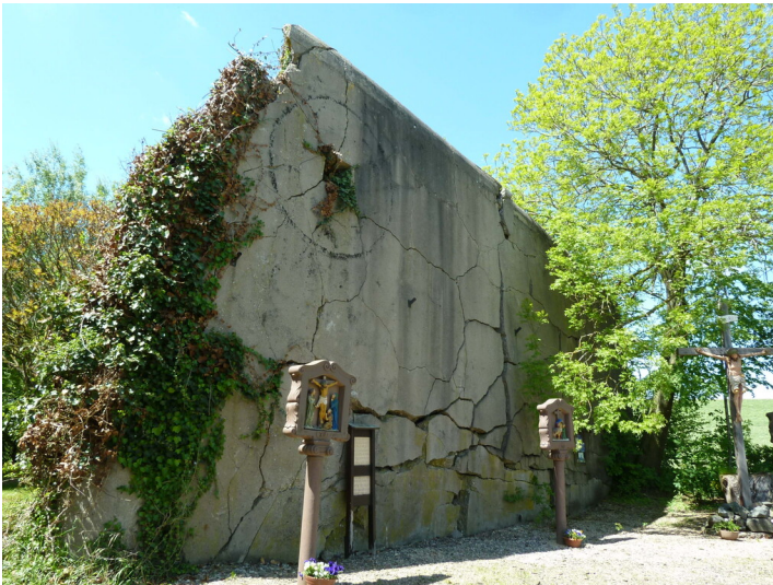
Bunkerwand-Kreuzweg in Eschfeld