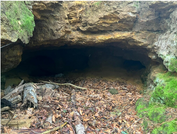
Die "Brotmanns Höhle" in der Üfter Mark im westlichen Münsterland (2023).