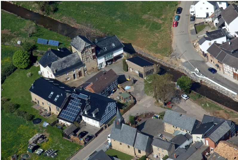
Luftbild der Burgmühle Arloff (2021)