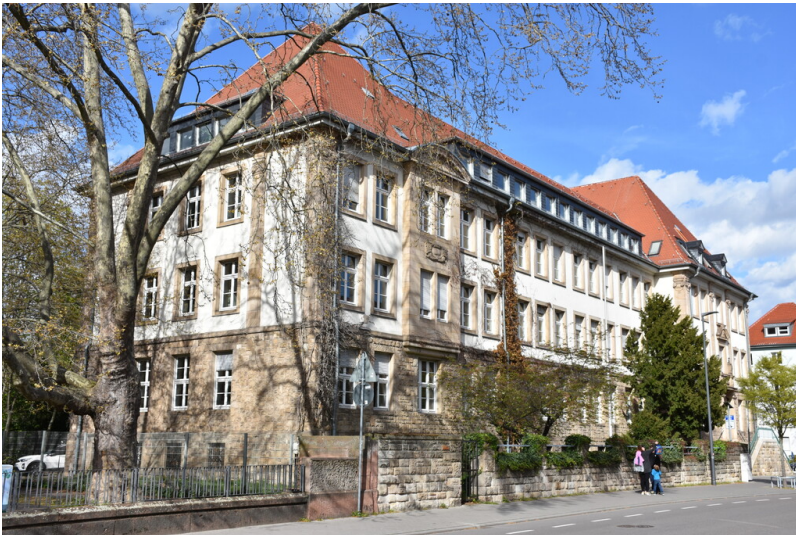
Hauptfassade Konrad-Adenauer-Straße