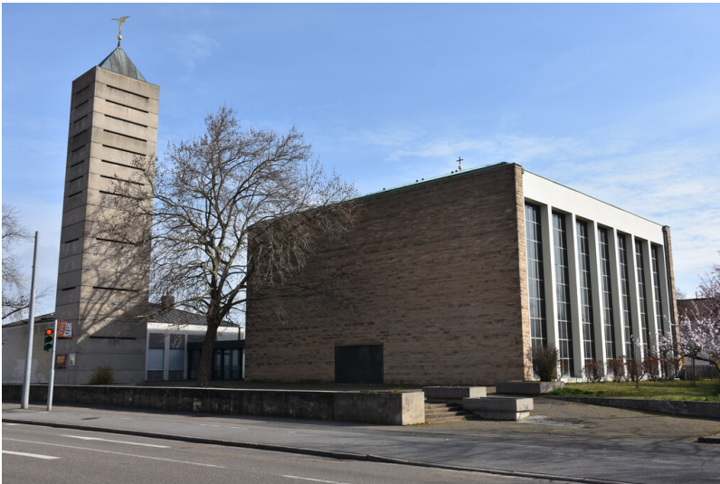
Protestantische Martin-Luther-Kirche in Neustadt an der Weinstraße