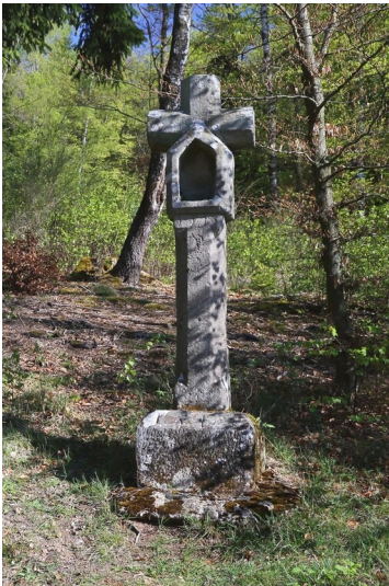
Blutkreuz bei Büdesheim