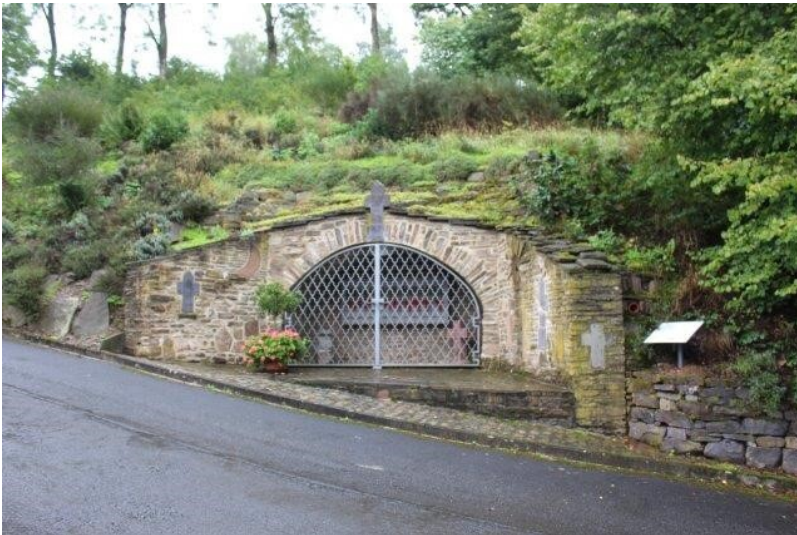
Gondenbretter Beinhaus