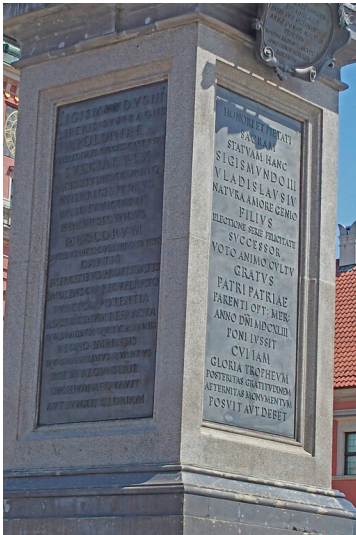
Sigismundsäule in Warschau (2023)