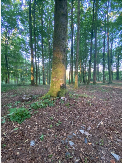
Buchen im Begräbniswald Niederweiler