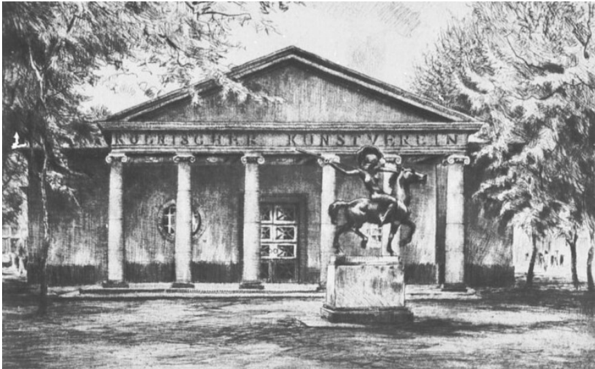
Radierung von Paul Prött (um 1930): Das Gebäude des Kölnischen Kunstvereins am Kölner Friesenplatz, davor eine Reiterstatue. Fotograf/Urheber: Paul Prött