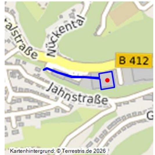
Klöppels-Mühle und Schemels-Mühle am Brohlbach in Burgbrohl-Weiler