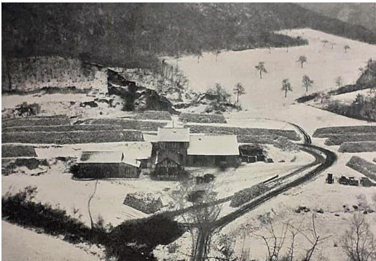
Zervas-Mühle am Brohbach in Brohl-Lützing