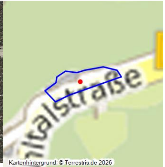
Netze-Mühle am Brohlbach in Brohl-Lützing

Die Netze-Mühle (jun.) ist eine sehr junge Mühle. Sie wurde 1873 durch Hubert Netz (geboren 1818 in Brohl) erbaut, wie es der abgebildete Stein über dem Türbogen zeigt. Ein unterschlächtiges Wasserrad trieb die Mühle an.