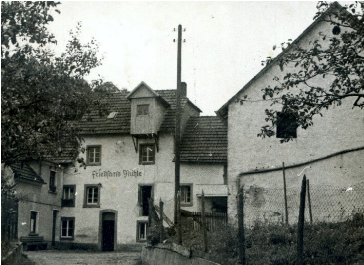
Friedsams-Mühle am Brenkbach in Oberzissen