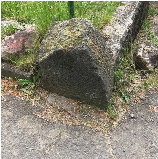
Reichhards-Mühle am Brohlbach in Niederdürenbach (2024)