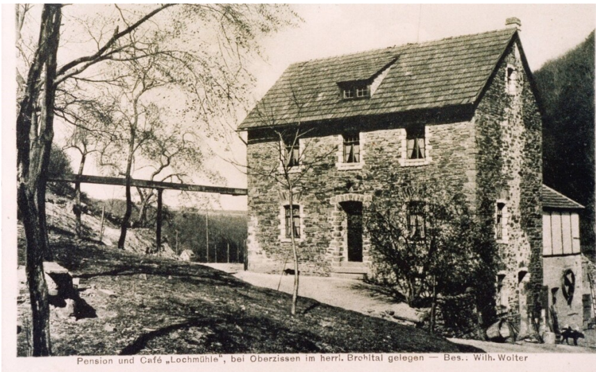
Pension und Café „Lochmühle“, bei Oberzissen im herrl. Brohthal gelegen — Bes.: Wilh. Wolter

Lochmühle am Brohlbach in Holzwiesen