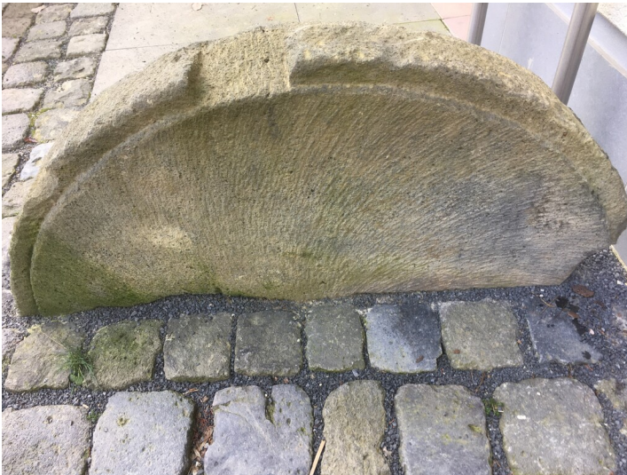
Pöntermühle am Pönterbach in Kell (2022)