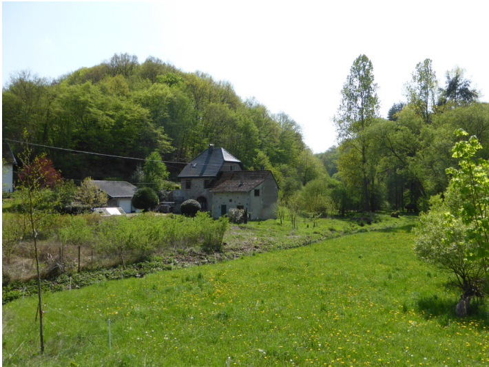
Krayermühle am Pönterbach in Kell (2019)