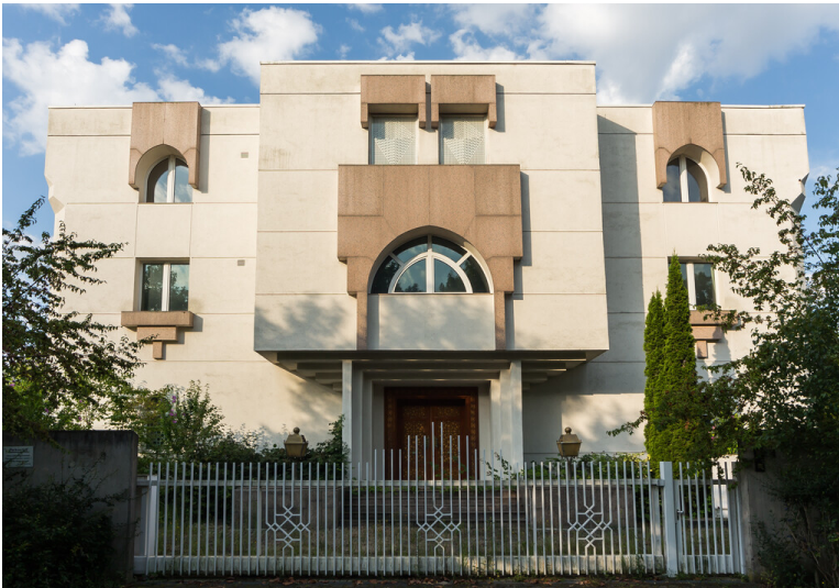
Ehemalige Botschaft der Arabischen Republik Syrien in Bonn (2014)