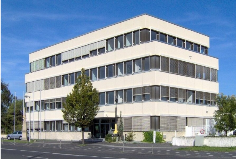
Dienstsitz der ehemaligen Ständigen Vertretung der DDR (2006)