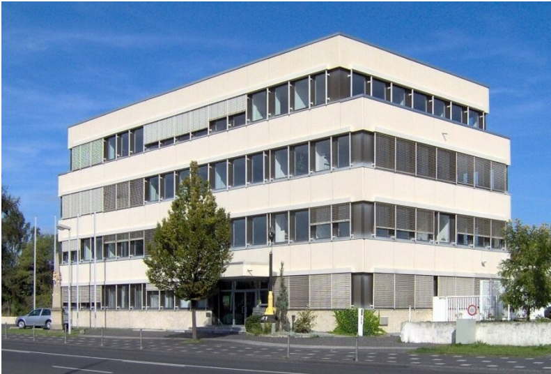
Dienstszitz der ehemaligen Ständigen Vertretung der DDR (2006)