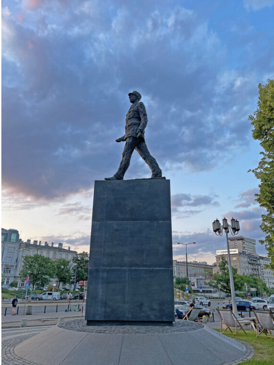
Denkmal für Charles de Gaulle in Warschau (2023)