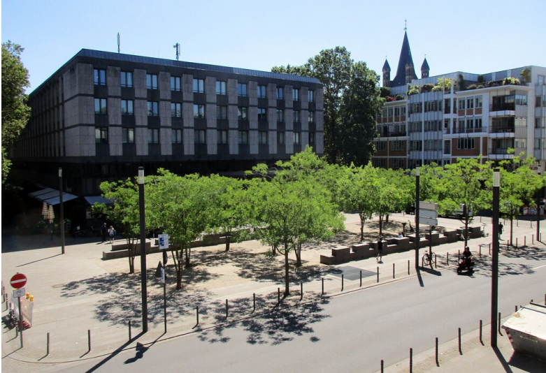
Blick über den Kurt-Hackenberg-Platz in Köln-Altstadt-Nord vom Römisch-Germanischen Museum aus (2023).