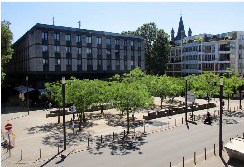
Blick über den Kurt-Hackenberg-Platz in Köln-Altstadt-Nord vom Römisch-Germanischen Museum aus (2023).