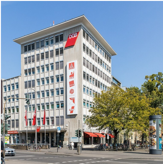
Das DGB-Haus am Hans-Böckler-Platz 1 in Köln-Neustadt-Nord, rechts davon der namensgebende Hans-Böckler-Platz (2018).