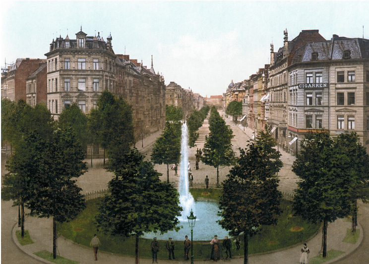
Historische Aufnahme (zwischen 1890 und 1905): Blick über den Kölner Barbarossaplatz und die Straße Hohenstaufenring.