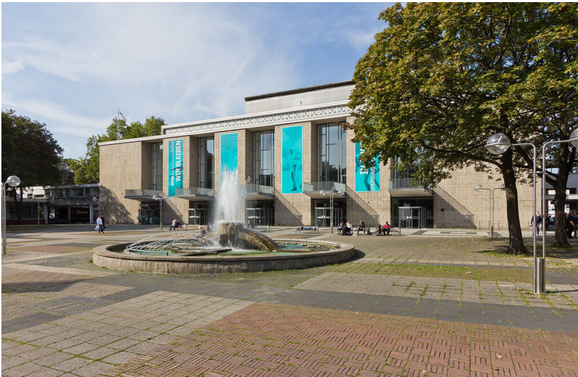
Die denkmalgeschützte Anlage des Offenbachplatzes mit dem Opernbrunnen in Köln-Altstadt-Nord (2011).