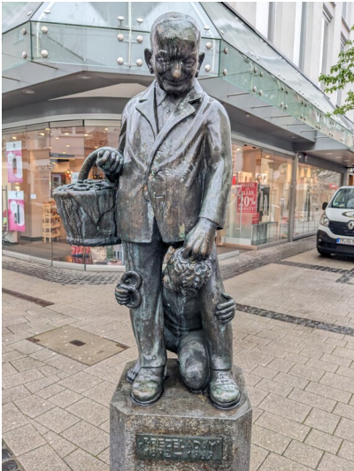
Denkmal für den Brezel-Adam in Kaiserslautern