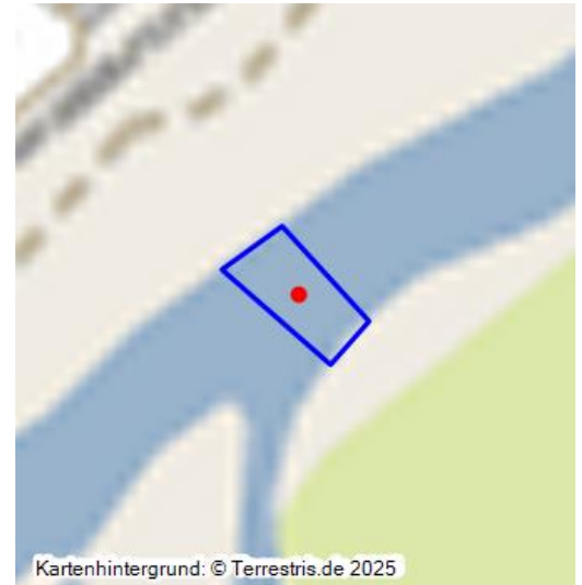
Kartenhintergrund: © Terrestris.de 2025