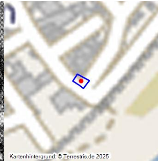
Galgen und Gefängnisse in Bretzenheim (1542)