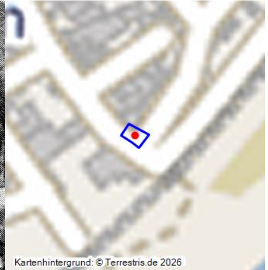
Galgen und Gefängnisse in Bretzenheim (1542)

Wenn alte Gebäude Gegenstand geschichtlicher Betrachtungen sind, so sind es in erster Linie Kirchen, Klöster, Schlösser und Burgen, denen das besondere Interesse gilt. Aber auch profanere Gebäude wie Mühlen, Backhäuser, Gutshöfe oder besonders markante Wohnhäuser können noch einer gewissen Beachtung sicher sein.