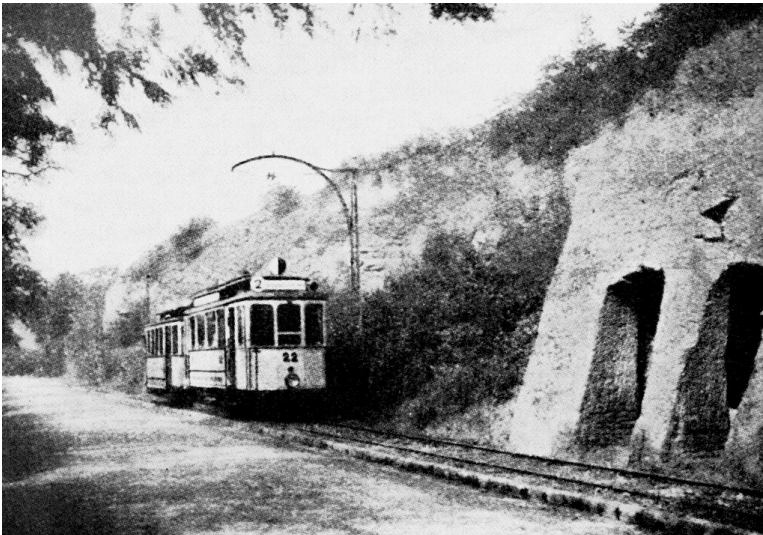
Ehemalige Straßenbahn durch Bretzenheim