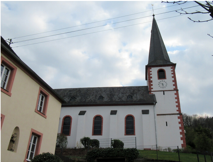
Katholische Pfarrkirche Sankt Margareta in Kenn (2023)