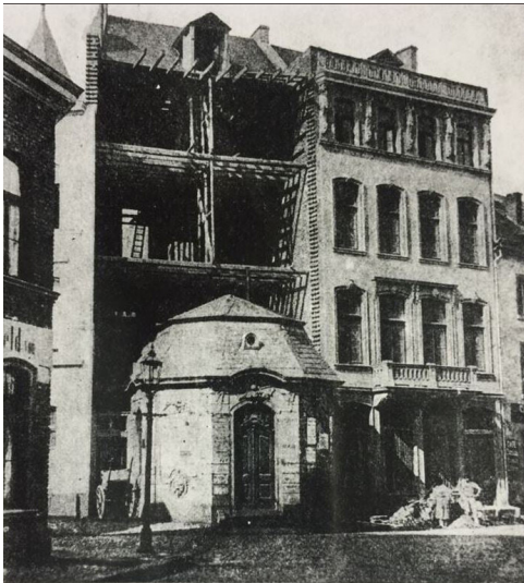
Historische Aufnahme aus der Zeit des Zweiten Weltkriegs: Das vermutlich letzte Kölner "Kettenhäuschen" vor einem offenbar kriegsbeschädigten Haus an der Ecke Marzellenstraße / Dominikanerstraße (heute An den Dominikanern).