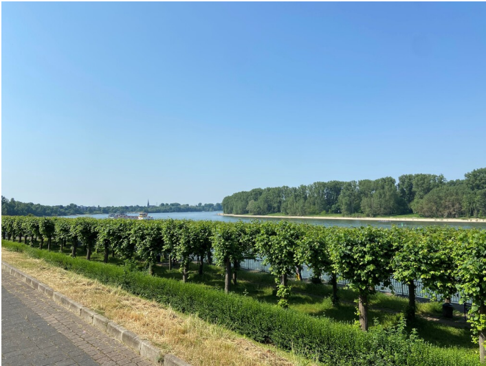
Aussicht auf den Rhein vom Friedrich-Ebert-Ufer in Porz aus mit Blick nach Süden in Richtung Zündorf (2023).