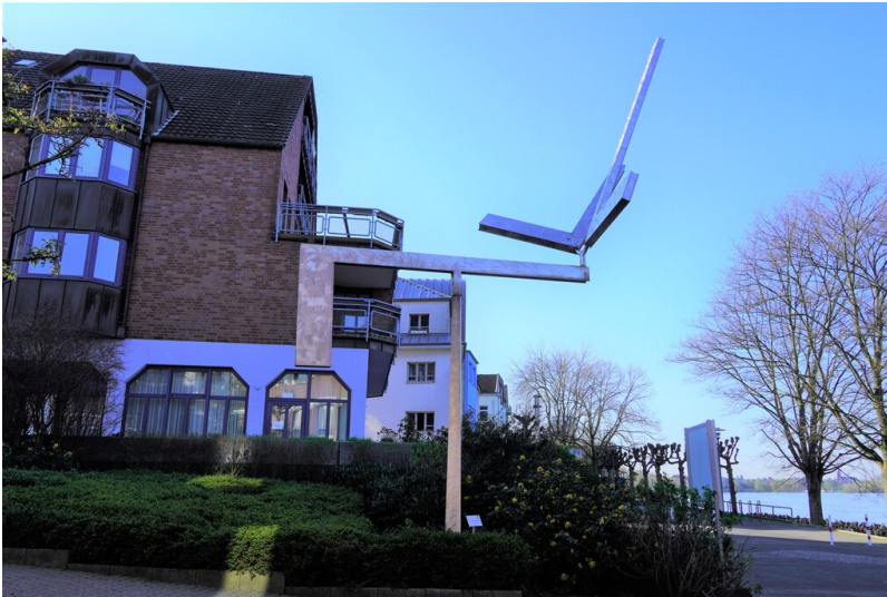
Kinetisches Kunstwerk "Triple L" von George Rickey in Köln-Porz (2023).