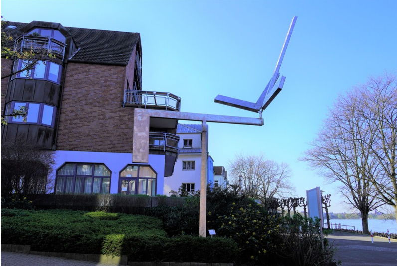
Kinetisches Kunstwerk "Triple L" von George Rickey in Köln-Porz (2023).