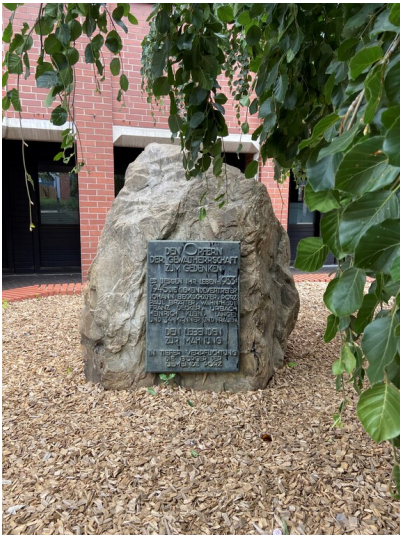
Denkmal für während der NS-Zeit ermordete Gemeindevertreter auf dem Alfred-Moritz-Platz in Köln-Porz (2023).