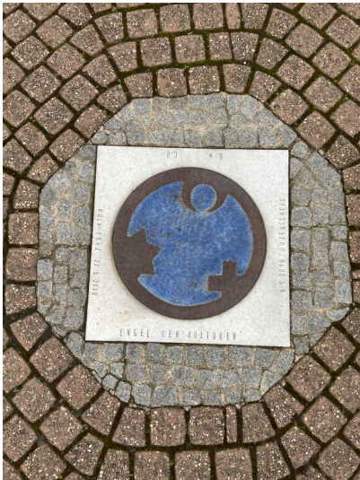
Kunstinstallation "Engel der Kulturen" des Künstlerpaares Carmen Dietrich und Gregor Merten auf dem Alfred-Moritz-Platz in Köln-Porz (2023).