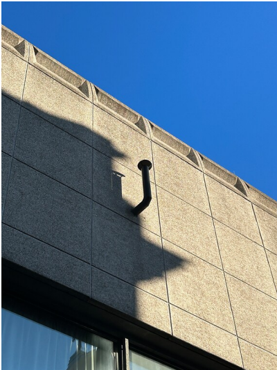
Das „Ofenrohr“ der Arbeit „Loch“ von Joseph Beuys (2023)