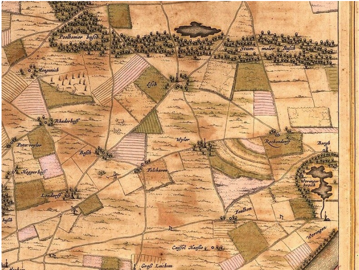
Ausschnitt eines Kupferstichs von Joan Blaeu (1596-1673), die auf 1663 datierte Karte "Descriptio Agri Civitatis Coloniensis" zeigt die Umgebung von Köln.