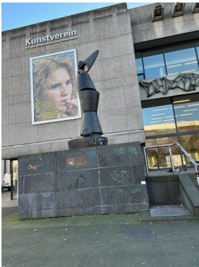
Die Bronze-Skulptur "Habakuk" in der Düsseldorfer Altstadt (2023)