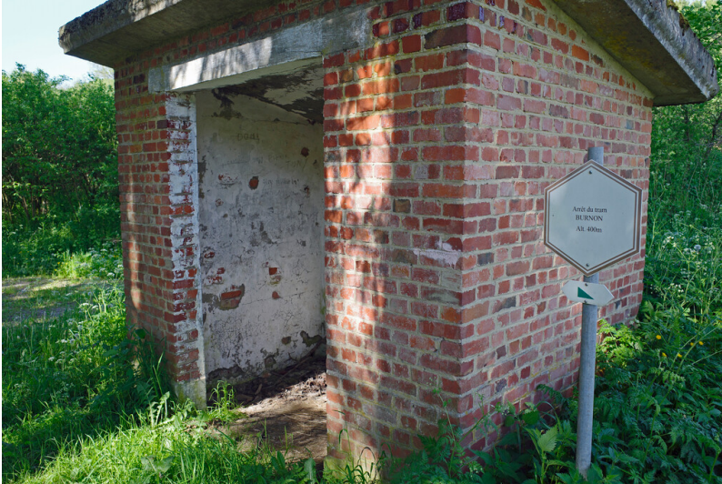
Haltepunkt Burnon an der ehemaligen Bahnstrecke von Bastogne nach Martelange (2023)