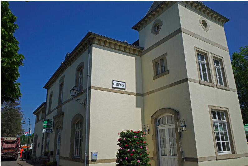
Ehemaliger Bahnhof Clemency (2023)