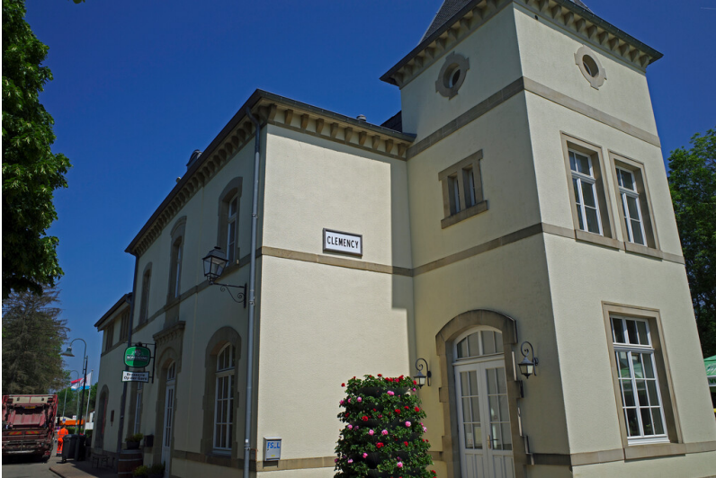
Ehemaliger Bahnhof Clemency (2023)