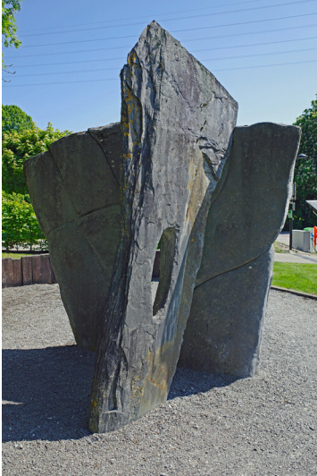
Gedenksteine zur Erinnerung an die Schieferabbaugeschichte Martelanges (2023)