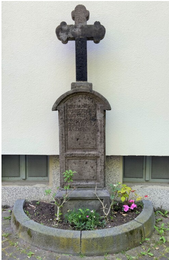
Das Schöffenkreuz in Köln-Porz an der Ecke Friedrich-Ebert-Ufer/Steinstraße (2023).