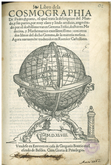
Bibliothek von Georg von Neumayer in der Pfälzischen Landesbibliothek