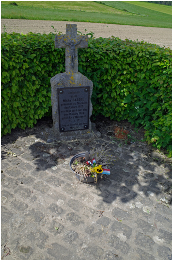
Denkmal für Michel Sassel (2023)