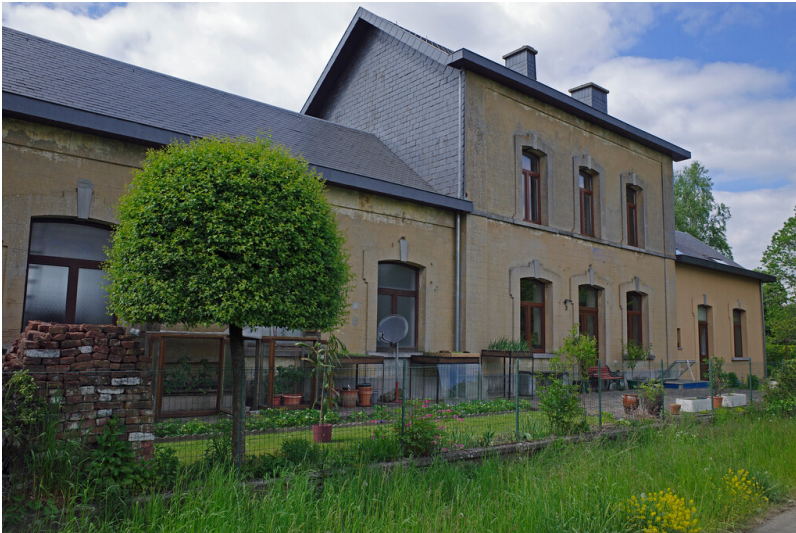
Kohle und Erz